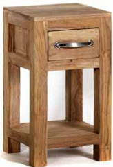
Telefontisch ‚Monterey‘, 1 Schublade,

mit offener Lehne 45 x 100 x 45cm - Art. 32508