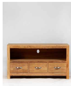
TV-Tisch ‚Monterey‘, 1 Fach mit Kabeldurchführung, 3 Schubladen, B 40cm x H 14,5cm (innen), wird montiert geliefert