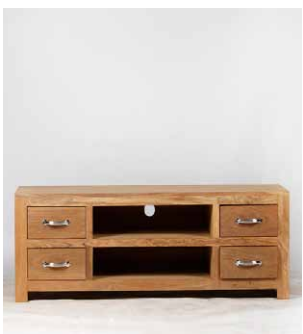
TV-Tisch ‚Monterey‘, 2 Fächer, Fachgröße: B 70cm x H 15cm, Kabeldurchführung oberes Fach, 4 Schubladen, Schubla- dengröße: B 30,5cm x H 12cm (innen),