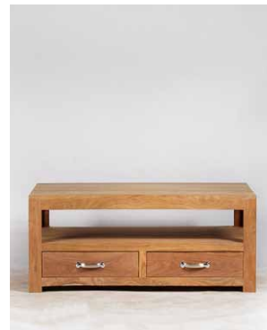
Couchtisch ‚Monterey‘, 1 Fach, 2 Schubladen, Schub- ladengröße: B 47,5cm x H 9cm (innen), wird montiert geliefert

Gr.1: 55x45x35 cm Gr.2: 40x37x35 cm Gr.3: 25x29x35 cm Art. 32503