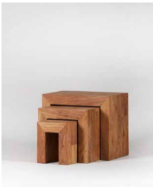
Hockersatz ‚Monterey‘, 3-teilig

Gr.1: 55x45x35 cm Gr.2: 40x37x35 cm Gr.3: 25x29x35 cm Art. 32503