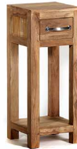
Telefontisch ‚Monterey‘, hoch, 1 Schublade