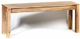
Bank ‚Monterey‘, 160 cm, Bei- ne 7x7cm, wird montiert gelie- fert