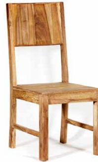
Stuhl ‚Monterey‘, wird mon- tiert geliefert

mit geschlossener Lehne 45 x 100 x 45cm - Art. 32507