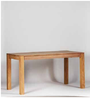
Esstisch ‚Monterey‘, Tischbeine 9x9cm, wird zerlegt geliefert

160 x 76 x 90 cm - Art. 32504 180 x 76 x 90 cm - Art. 32505 200 x 76 x 100cm -Art. 32506