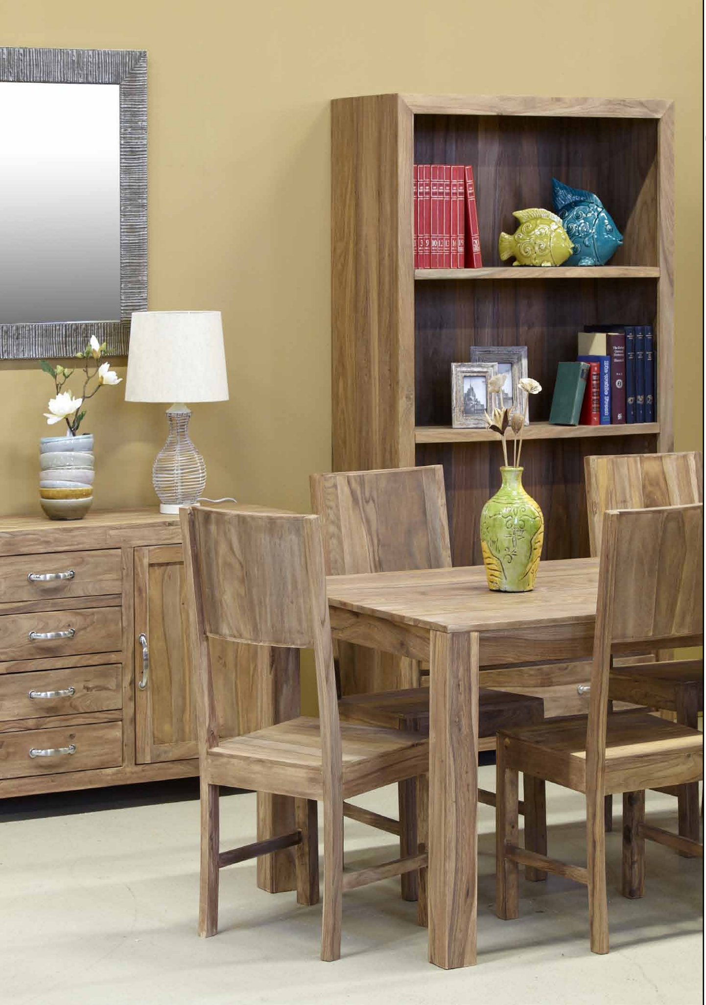
Möbel aus massivem schichtverleimten Shishamholz